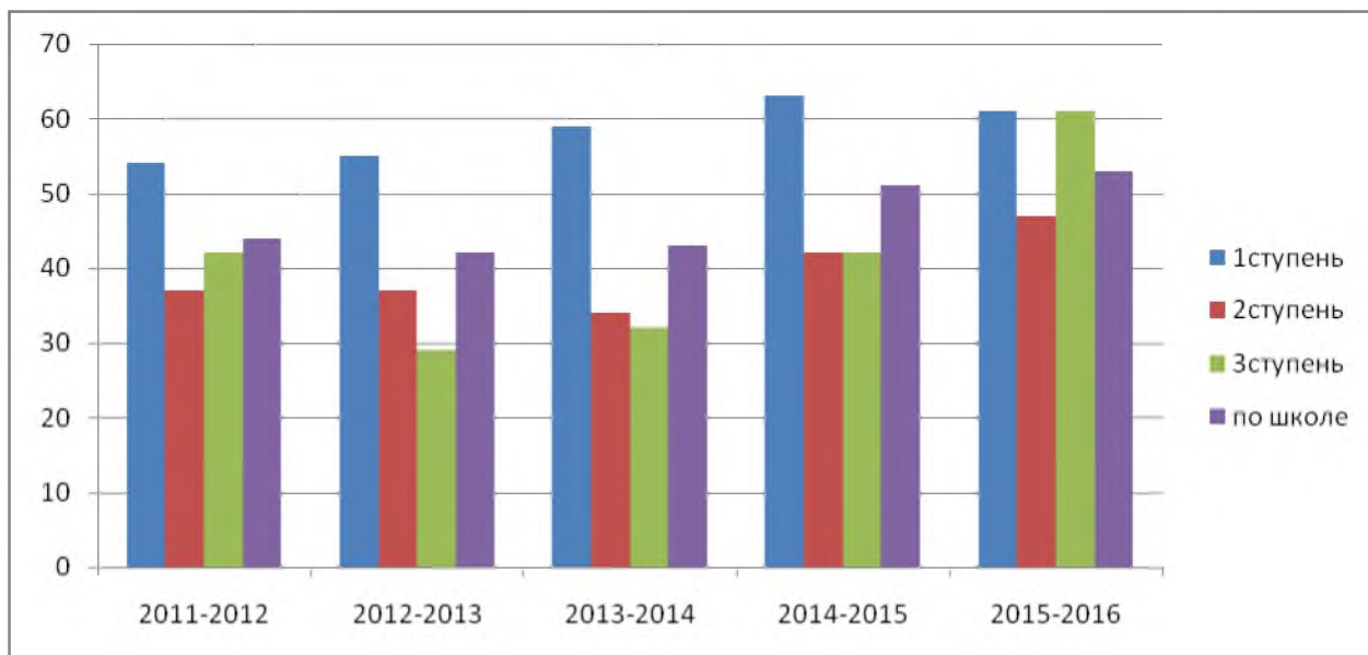
Диаграмма. Качество по ступеням в сравнении с прошлыми учебными годами.